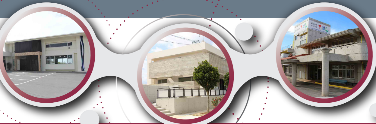
こども発達支援センター ココイロ

本人の夢を育て自分を育てる。個性（個々色→ココイロ）が輝くお手伝いができますように。「じぶんみらいココイロ」今後とも宜しくお願い致します。